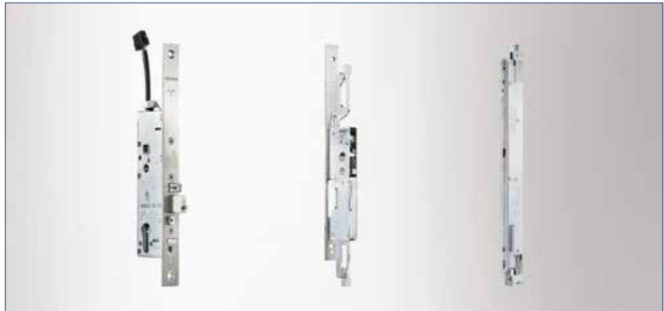
Motorický zámeček IQ lock EL DL, Protikus DL, Tyčový zámeček IQ AUT